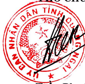
Trần Phước Hiền