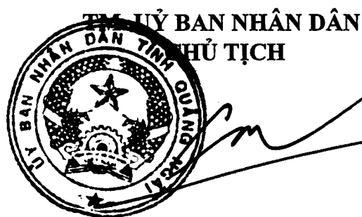
Trần Ngọc Căng

3. Các đơn vị trong mạng thông tin của Ủy ban nhân dân tỉnh phải thực hiện chế độ trao đổi thông tin qua mạng tin học diện rộng của Ủy ban nhân dân tỉnh theo quy định; thường xuyên theo dõi thông tin trên mạng tin học để kịp thời nhận văn bản chỉ đạo điều hành và các thông tin do Ủy ban nhân dân tỉnh gửi để quán triệt và thực hiện./.