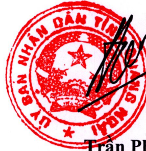
Trần Phước Hiền